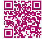
Demenz Partner- Schulung

In einer „Demenz Partner-Schulung“ lernt man, wie Menschen mit Demenz ihre Umwelt erleben und wahrnehmen. Man erhält zudem wertvolle Informationen, Tipps und Empfehlungen, um Betroffenen im Alltag sensibel zu begegnen und sie zu unterstützen. Bisher haben bereits über 100.000 Menschen an dieser Schulung teilgenommen. Die Initiative Demenz Partner, gefördert vom Bundesministerium für Gesundheit, steht allen Interessierten offen – egal, ob jung oder alt, berufstätig oder im Ruhestand, ob Menschen mit Demenz im persönlichen Umfeld leben oder nicht. Das Schulungsmaterial wird kontinuierlich mit Beispielen für verschiedene Berufsgruppen erweitert, etwa für Apothekerinnen und Apotheker. Da ihnen oft großes Vertrauen entgegengebracht wird, können sie Verhaltensänderungen bei ihnen bekannten Kundinnen und Kunden frühzeitig bemerken – beispielsweise, wenn diese Tabletten zu oft bestellen oder nicht mehr mit eigentlich vertrauten Medikamenten zurechtkommen.