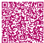
Bericht der DKG

Besonders herausfordernd wird ein Krankenhausaufenthalt, wenn Patientinnen und Patienten an Demenz oder Delir leiden beziehungsweise ein Delir entwickeln. Um dem vorzubeugen, werden in Krankenhäusern in Deutschland bereits verschiedene Maßnahmen der Nationalen Demenzstrategie umgesetzt. So zeigt ein von der Deutschen Krankenhausgesellschaft e. V. (DKG) in Auftrag gegebener Bericht , dass ein breites Angebot an demenzspezifischen Weiterbildungen für das Krankenhauspersonal vorhanden ist. Zudem gehört es in den meisten Krankenhäusern zur gängigen Praxis, Kurzscreenings zur Erkennung kognitiver Störungen durchzuführen und diese Beeinträchtigungen bei der Zuteilung von Patientenzimmern zu berücksichtigen. Auch organisatorische Abläufe werden an die Bedürfnisse von Menschen mit Demenz angepasst, beispielsweise durch Untersuchungen auf Station, also ohne Ortswechsel, möglichst kurze Wartezeiten oder die Begleitung auf Wegen innerhalb des Krankenhauses.