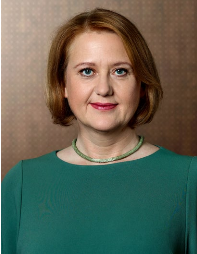
Lisa Paus, MdB Bundesministerin für Familie, Senioren, Frauen und Jugend

Demenz geht uns alle an. So beginnt das Vorwort zum Start der Nationalen Demenzstrategie wie auch unser Grußwort nach drei Jahren zur Halbzeit. Dieser Satz bringt nach wie vor unser Handeln und unser Ziel zum Ausdruck: Alle Akteure der Nationalen Demenzstrategie arbeiten gemeinsam daran, das Bewusstsein für Demenz in der gesamten Gesellschaft weiter zu schärfen, betroffene Menschen und ihre Angehörigen stärker zu unterstützen, die medizinische und pflegerische Versorgung weiterzuentwickeln und die Forschung zu fördern.