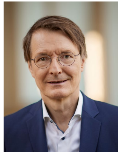
Prof. Dr. Karl Lauterbach Bundesminister für Gesundheit